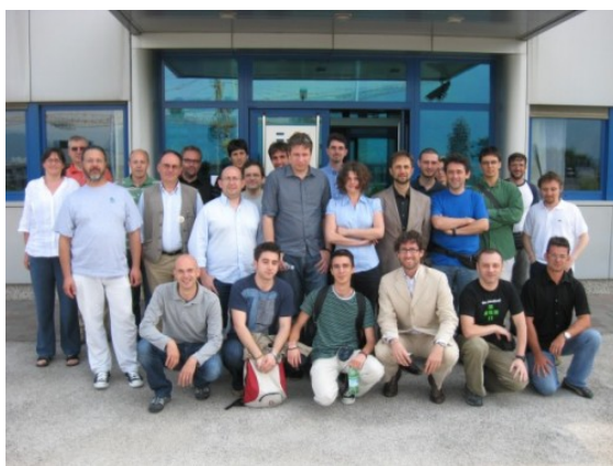
Figura 3: La foto di gruppo di OSMit 2009