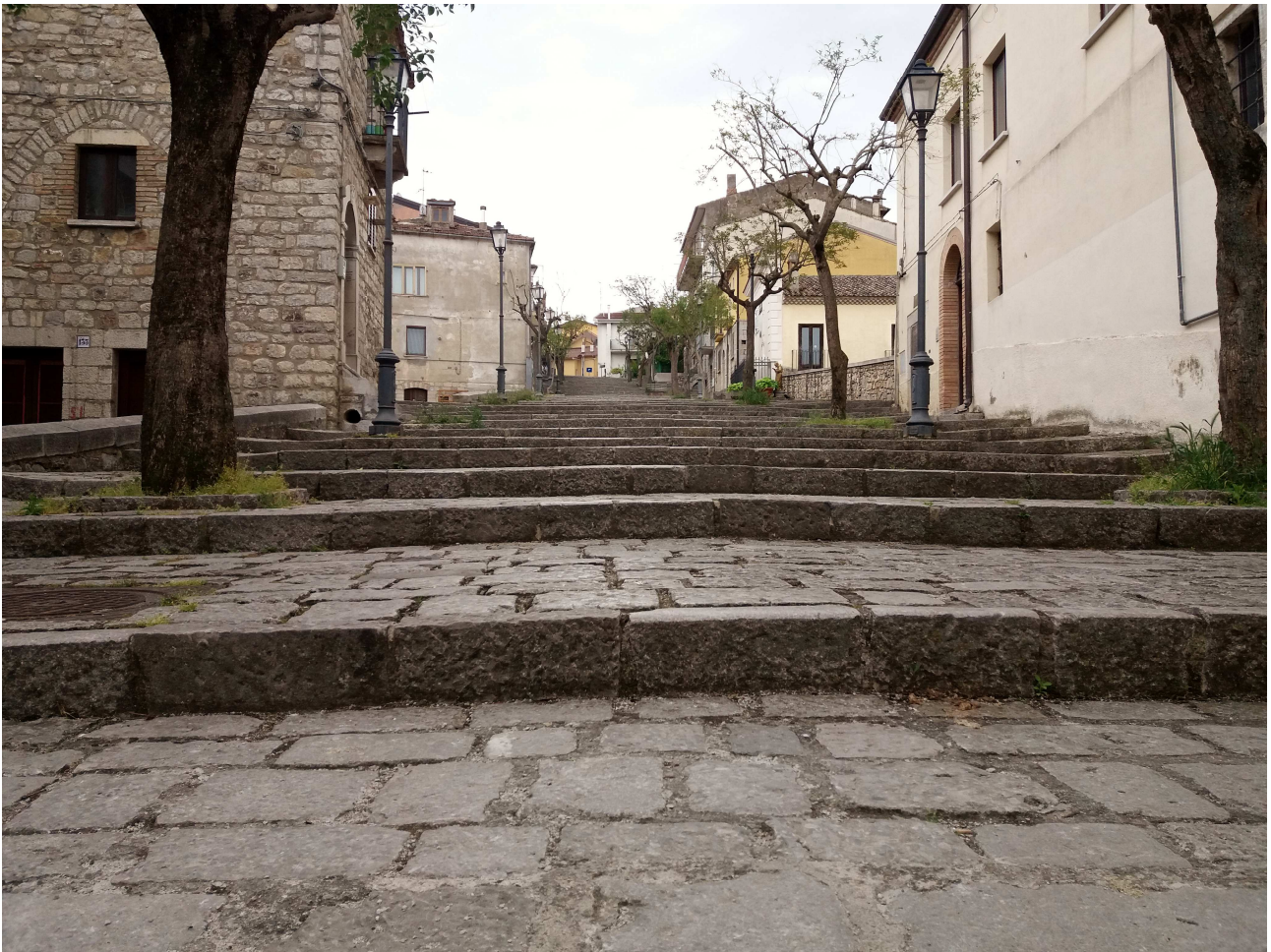
Figura 7 – La gradinata di via Vittorio Emanuele III a Cancellara (PZ)