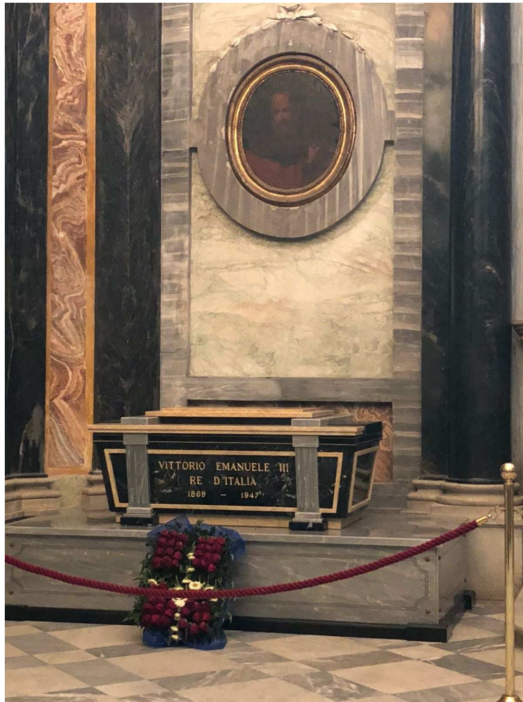
Figura 3 - Tomba di Vittorio Emanuele III al Santuario di Vicoforte (CN) nella cappella di San Bernardo