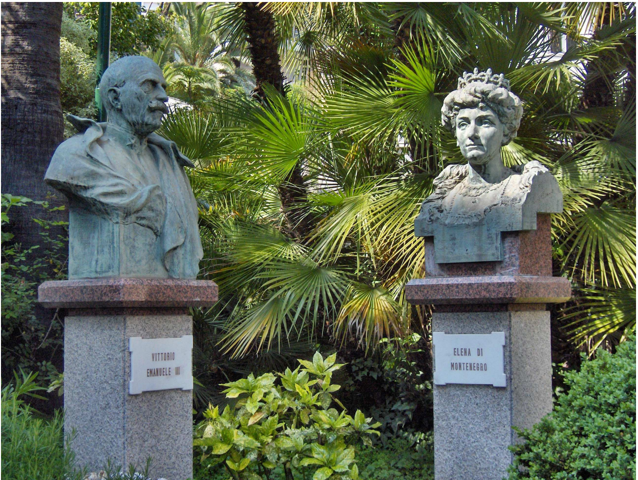
Figura 2 - Busto del Re Vittorio Emanuele III a Sanremo