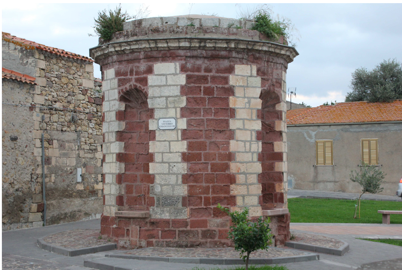
Figura 6 – La Funtana Noa sita in Piazza Vittorio Emanuele III a Maris (SS)

La forte presenza di odonimi dedicati a Vittorio Emanuele III in Sardegna (42 unità) è dovuta al fatto che al referendum costituzionale del 2 giugno 1946 con le percentuali del 60,9 % 12 a Cagliari i no si opposero all'introduzione della Repubblica.