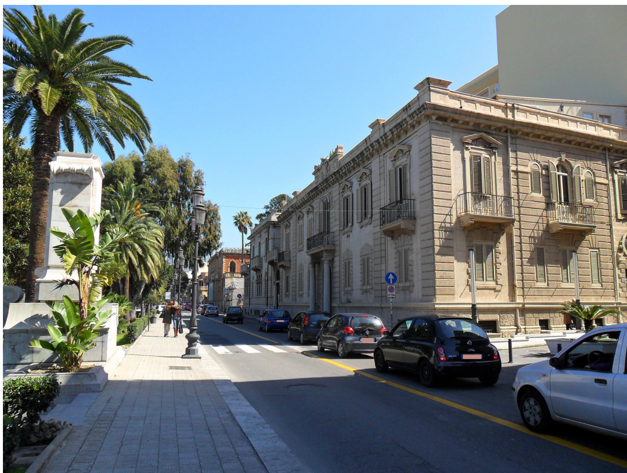
Figura 8 – Un tratto di corso Vittorio Emanuele III a Reggio Calabria