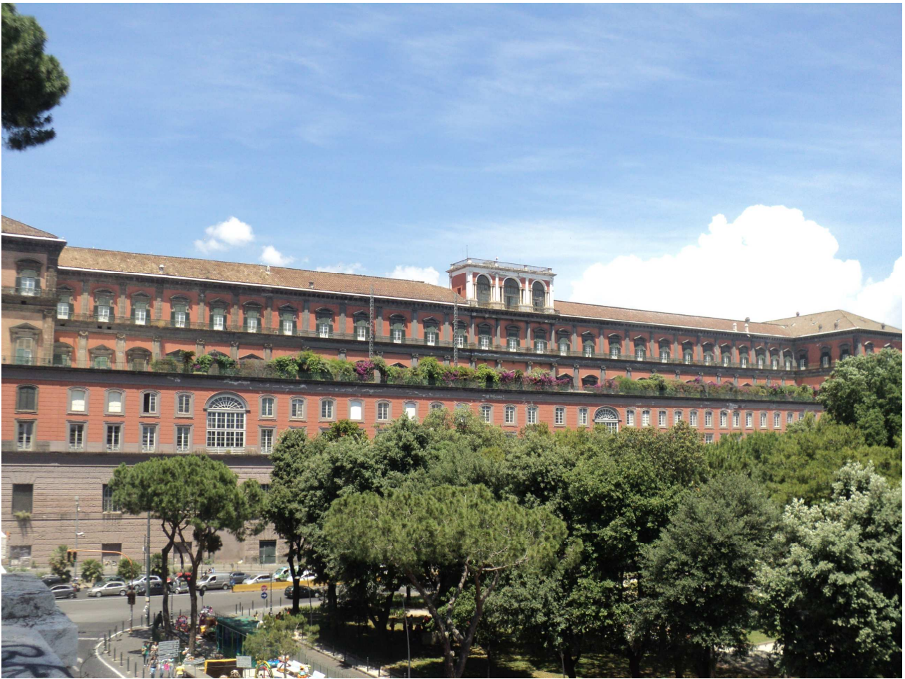
Figura 5 – Facciata della Biblioteca Nazionale Vittorio Emanuele III a Napoli