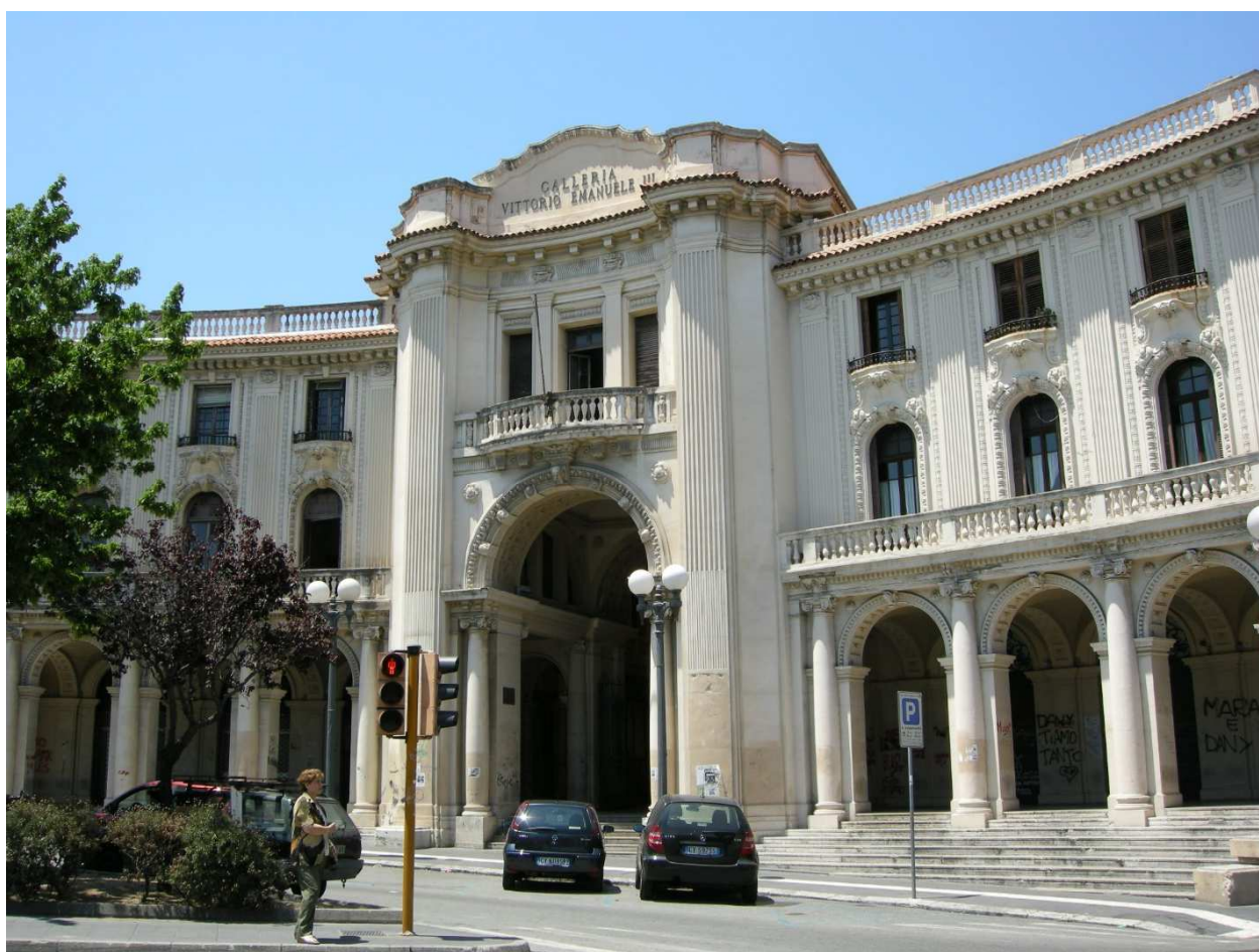
Figura 9 – La Galleria Vittorio Emanuele III a Messina

La forte presenza di odonimi dedicati a Vittorio Emanuele III in Sicilia (40 unità) è dovuta al fatto che al referendum costituzionale del 2 giugno 1946 con le percentuali del 61,0 % 15 a Palermo e con il 68,2% a Catania i no si opposero all'introduzione della Repubblica. Infine, si rappresenta che l'odonomo riferito al comune di Favignana (TP) è riferito in particolare a quello presente sull'isola di Marettimo.