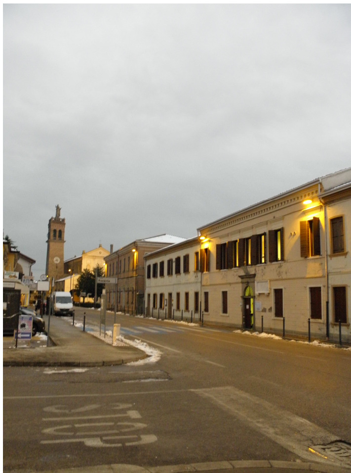
Figura 4 - Via Vittorio Emanuele III a Codevigo (PD)